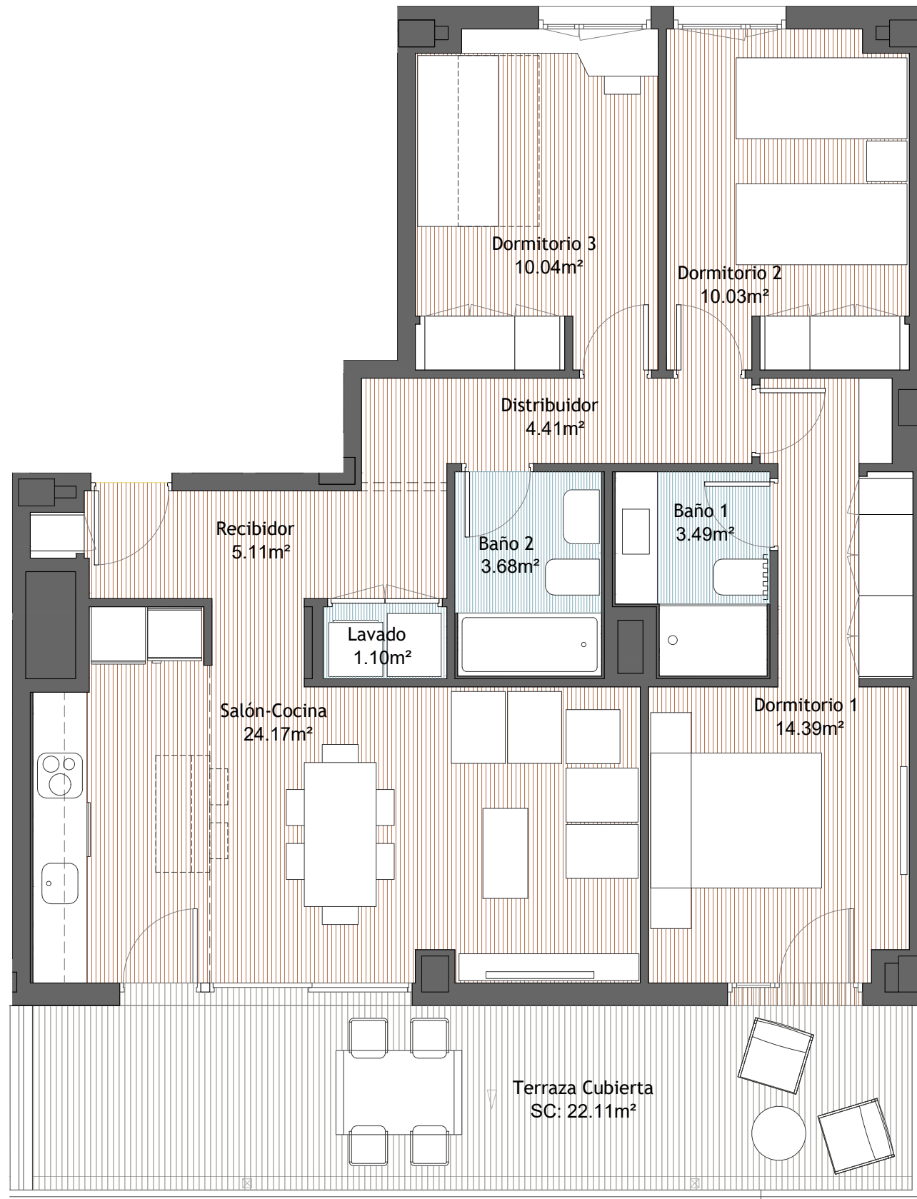
A3 - 1:60