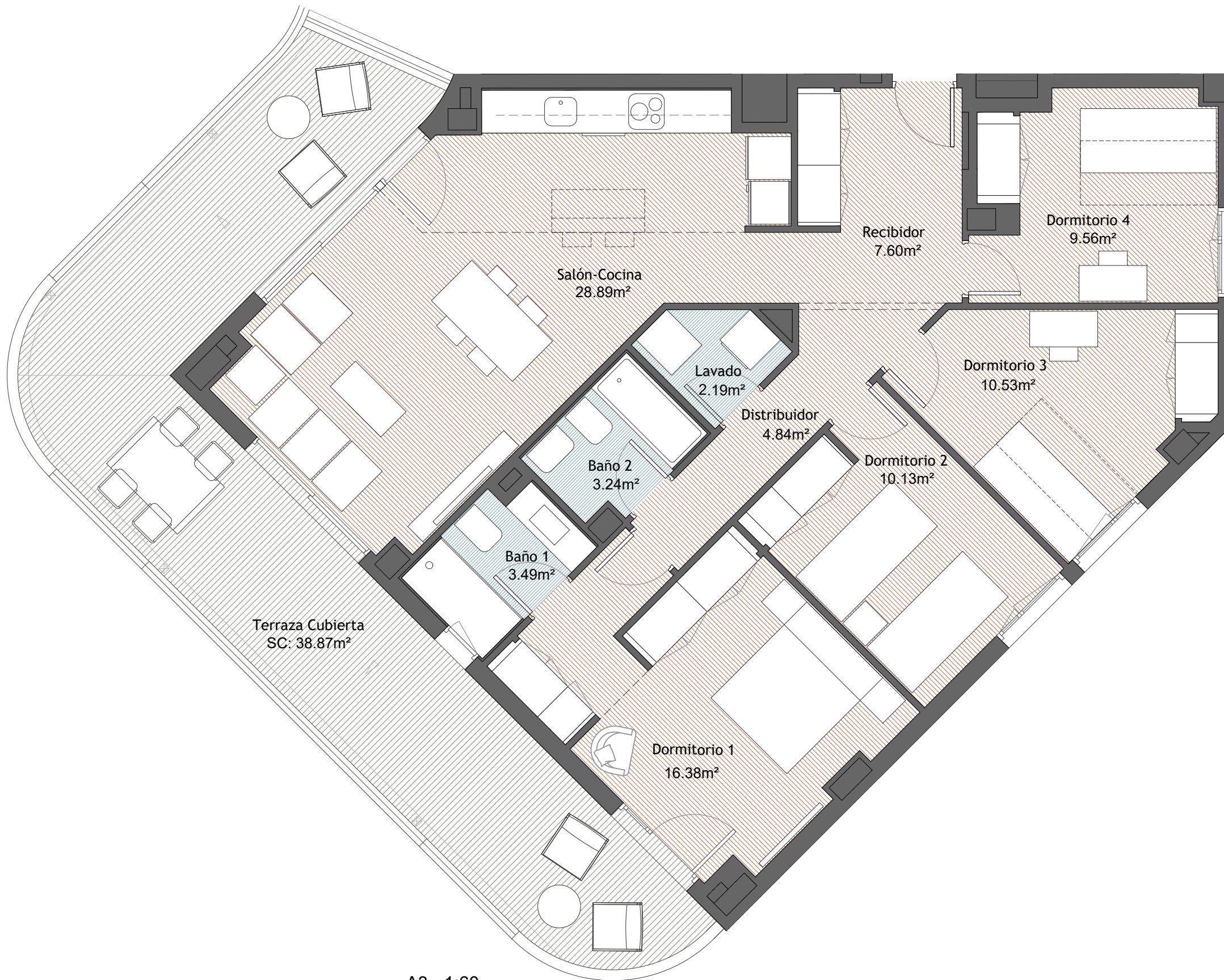
A3 - 1:60